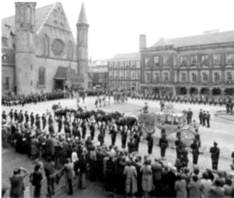
Afb. 1: De koets komt aan bij het Binnenhof

Om half twee komt ze aan bij het Binnenhof, waar de regering al op haar wacht. Koningin Beatrix stapt uit de koets en gaat naar binnen. Als ze op de troon zit, begint ze te lezen. "Leden der Staten Generaal..." zegt ze. Ze vertelt dat het niet goed gaat met Nederland, en dat de regering zal proberen om toch zoveel mogelijk geld over te houden. Ook zegt ze dat er meer geld voor de scholen moet komen, en dat het veiliger moet zijn in Nederland. Dan is ze klaar. 'Leve de koningin!' roepen de mensen.