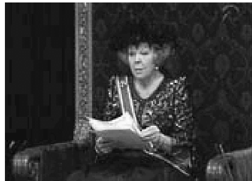
Afb. 2: De koningin leest de troonrede voor.

De minister-president maakt van al die verhalen één verhaal. Hij probeert het ook zo begrijpelijk mogelijk te maken. De 'Troonrede' is dus een verhaal van de regering.